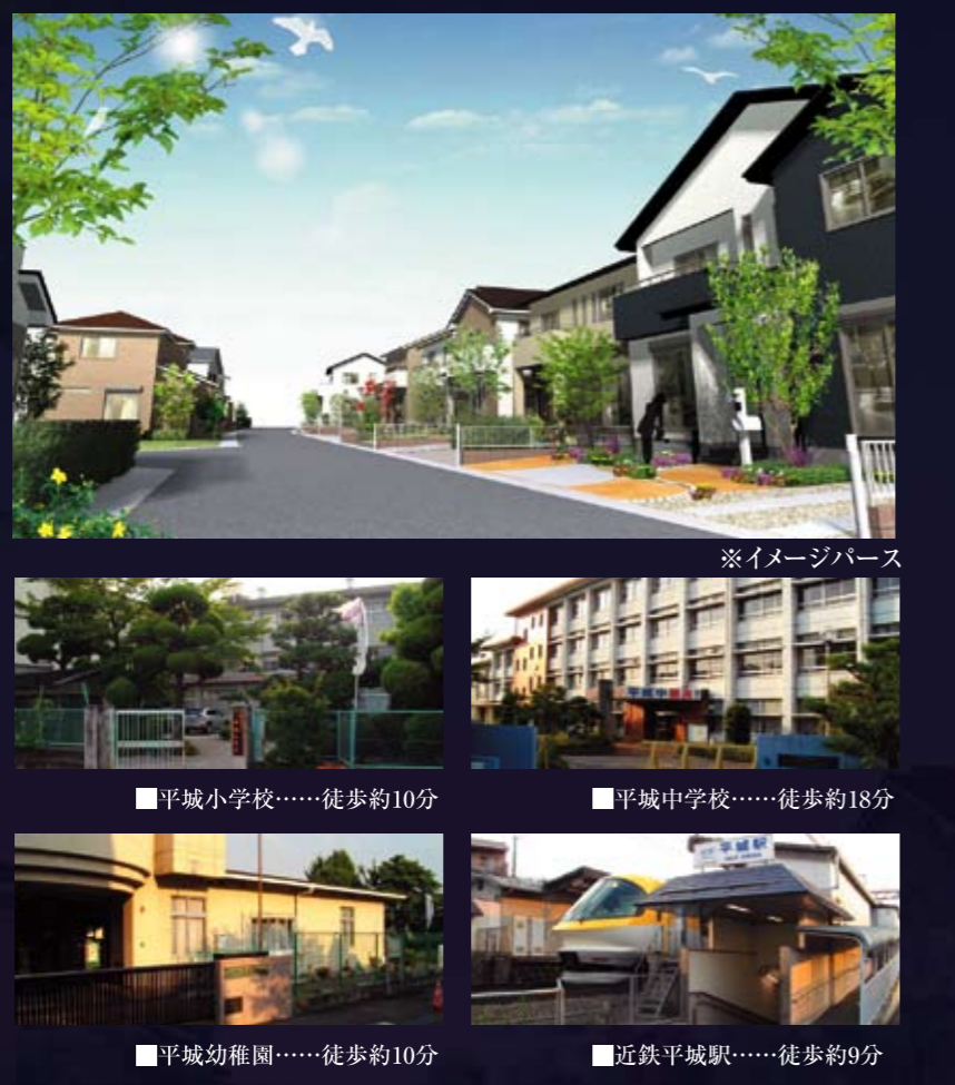
※イメージパース ■平城小学校……徒歩約10分 ■平城中学校……徒歩約18分 ■平城幼稚園……徒歩約10分 ■近鉄平城駅……徒歩約9分

みささぎ 奈良市山陵ニュータウン 土地価格 1,398.39万円より 165.10㎡ (約49.94坪) 建築条件付宅地